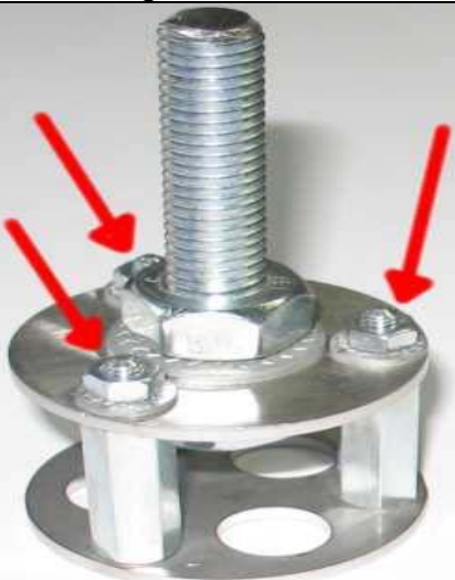
Zur Montage – Abnehmen der Oberen Scheibe

Die drei vorhandenen Schraubbefestigungen am Handrad werden benutzt, um die Grundplatte zu befestigen.