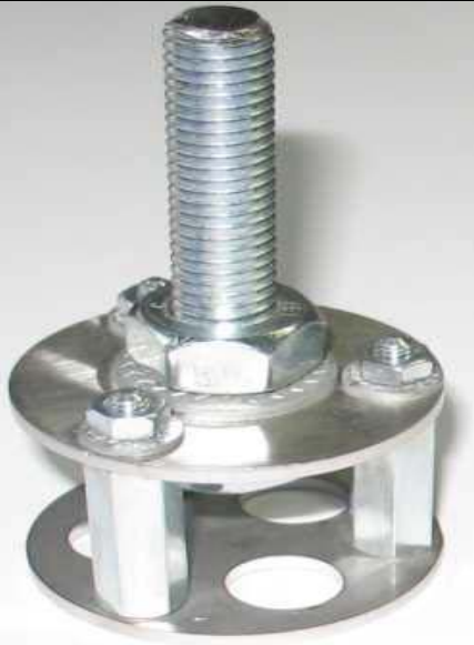
Darstellung von Thyssenwinde W149

Bei der Montage eines Impulsgebersystems an eine Thyssenwinde W149 stellt sich folgendes Problem, dass die Gewindebohrung in der Welle fehlt. Dafür gibt es den Anbausatz GD-W149.